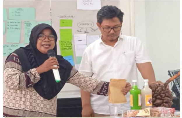
Pelatihan fasilitator rehabilitasi & konservasi mangrove di tingkat tapak