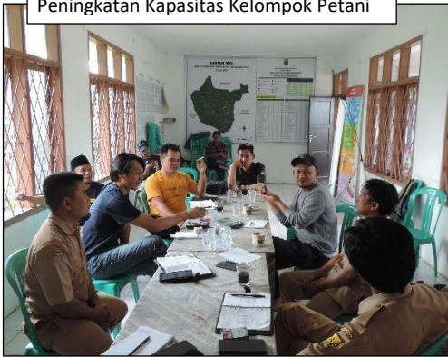
Peningkatan Kapasitas Kelompok Petani