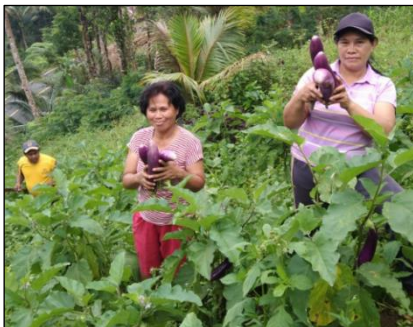
Hasil panen kelompok hortikultura