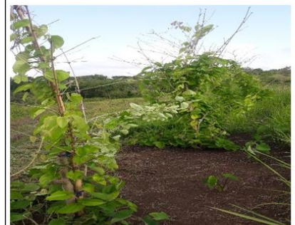
Ranting bambu tempat menjalar ubi manusia