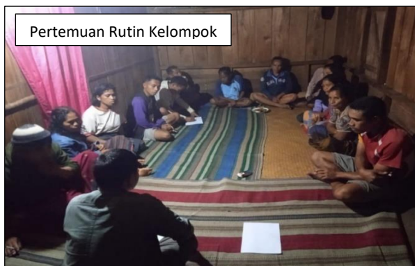
Pertemuan Rutin Kelompok