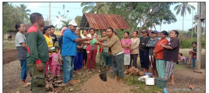
Pemberian dukungan pada kelompok Wanita Tani yang baru dibentuk