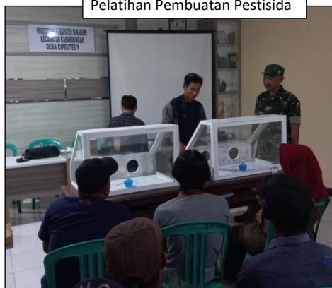
Pelatihan Pembuatan Pestisida