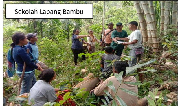
Sekolah Lapang Bambu