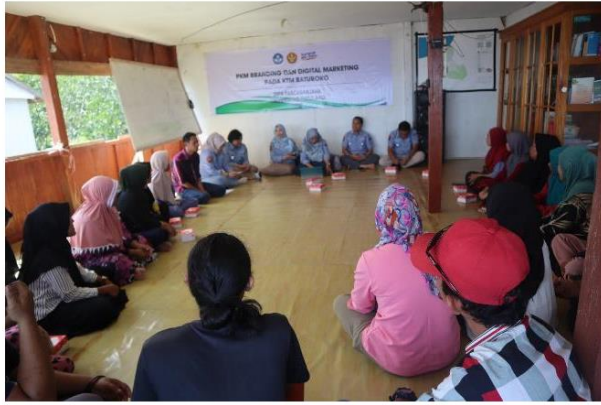
Fasilitasi Penguatan Kelompok usaha dan kerjasama usaha dan bisnis dengan mitra lainnya