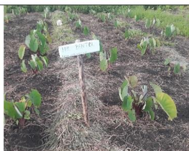
Masa pertumbuhan keladi