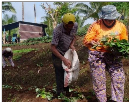
Kelompok Tanam Ubi