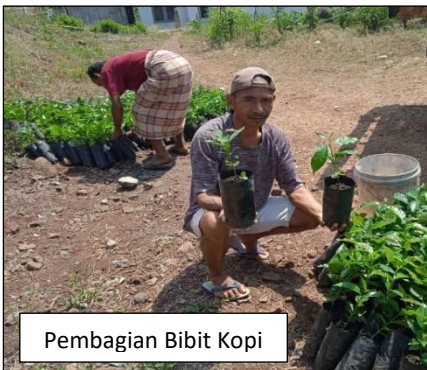
Pembagian Bibit Kopi