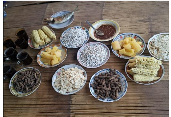
Pelatihan Pengolahan Pangan lokal Sorgum kepada siswa-siswa SMP pada peringatan Hari Pangan Sedunia