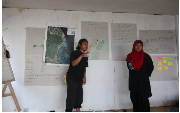
Aksi rehabilitasi dan konservasi mangrove di tingkat tapak berbasis inisiatif lokal