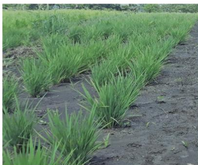
Tahap pembentukan anakan