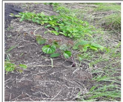
Pertumbuhan ubi manusia