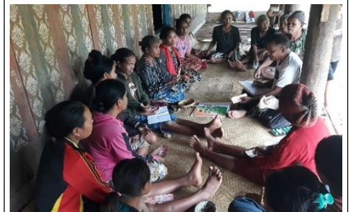
Pelatihan, pertemuan rutin