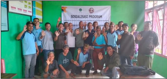
Sosialisasi Program 28 Jun 2023