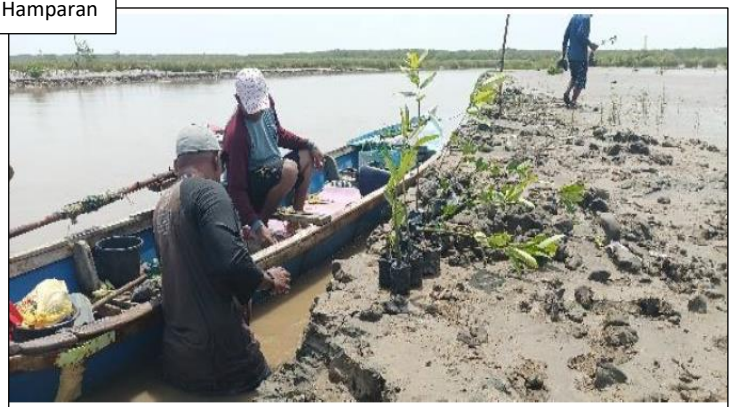
Penanaman di Hamparan