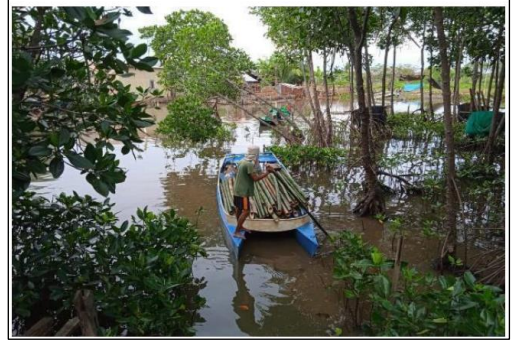
Pengangkutan bambu menuju lokasi penanaman