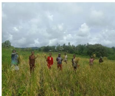
Tahap masak penuh dan panen padi