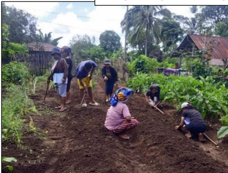
Pengembangan Horti dengan memanfaatkan pekarangan rumah KWT di Desa Rana Kolong