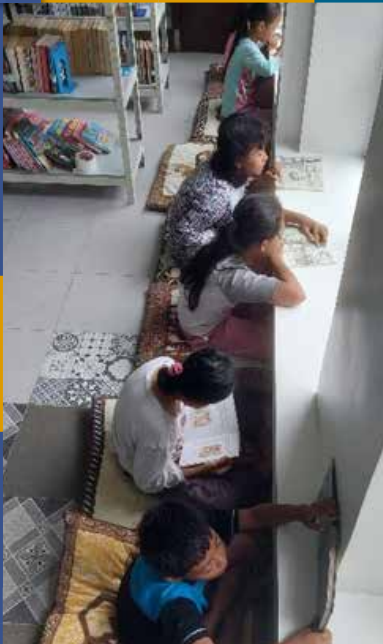
Kelas Belajar Study Class