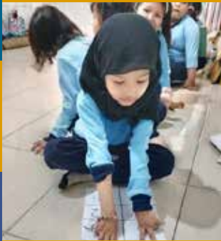
PAUD TULIP Tulip Pre-Schools