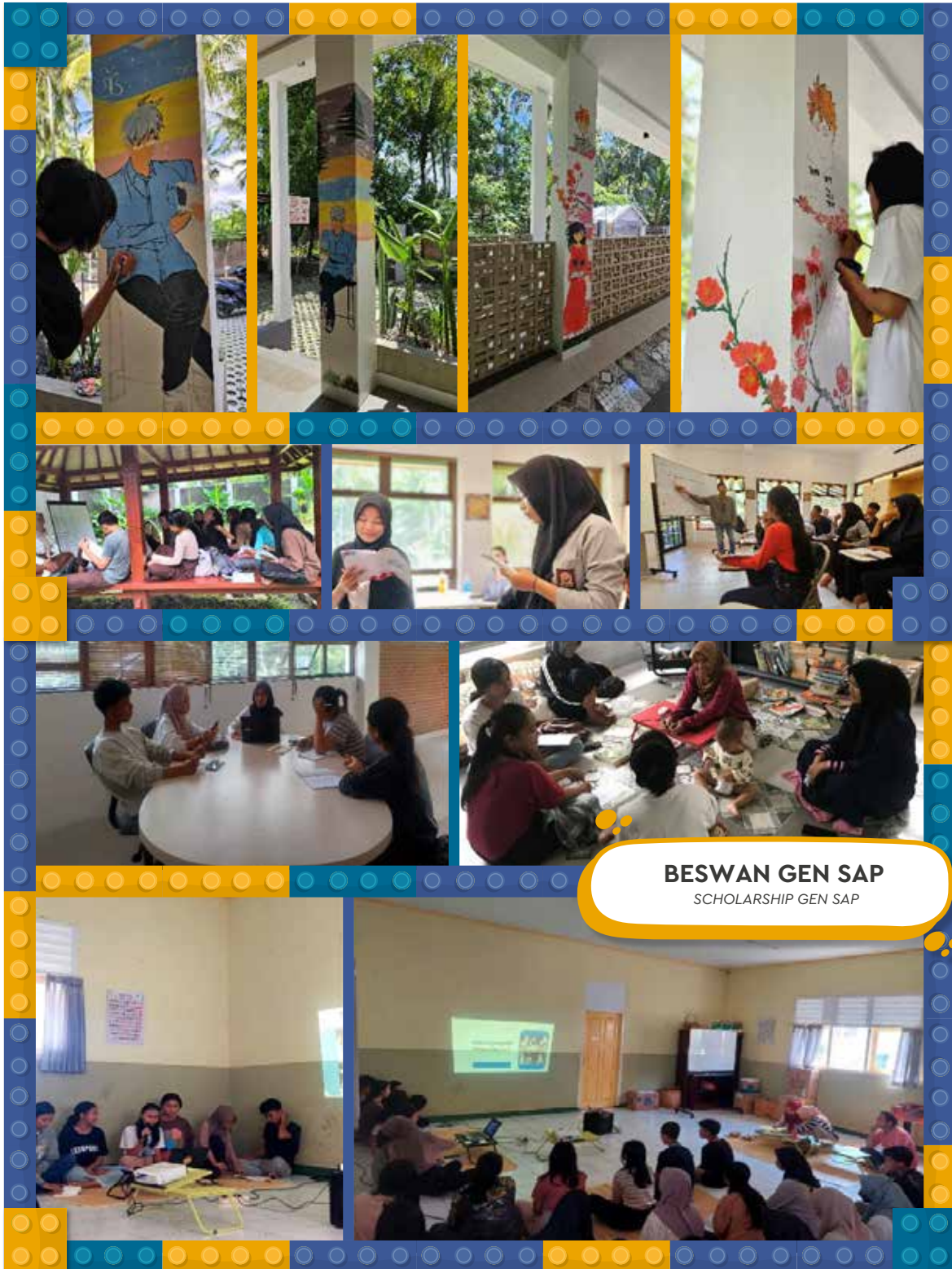
BESWAN GEN SAP SCHOLARSHIP GEN SAP

Pengembangan Masyarakat Community Development