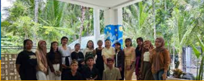
Peresmian Community Learning Center Inauguration of the Community Learning Center