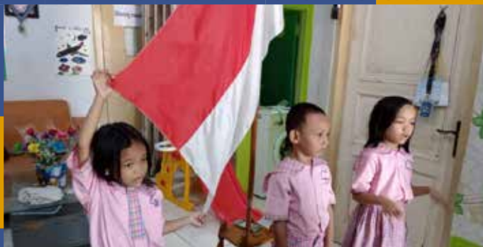
PAUD Bawal Bawal Pre-Schools