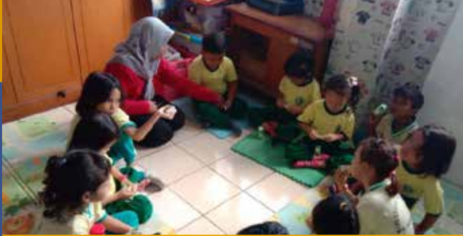
PAUD DEMANG CERIA Demang Ceria Pre-Schools

Pengembangan Masyarakat Community Development