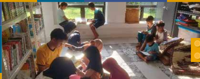
Kelas Belajar Study Class