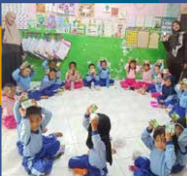
PAUD Bawal Bawal Pre-Schools