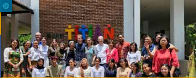
Peresmian Community Learning Center Inauguration of the Community Learning Center

Pengembangan Masyarakat Community Development