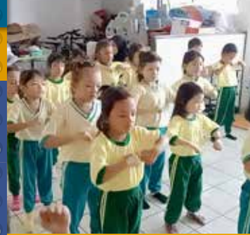
PAUD DEMANG CERIA Demang Ceria Pre-Schools