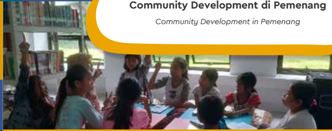
Kelas Belajar Study Class