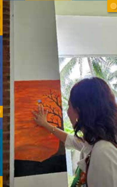
Peresmian Community Learning Center Inauguration of the Community Learning Center